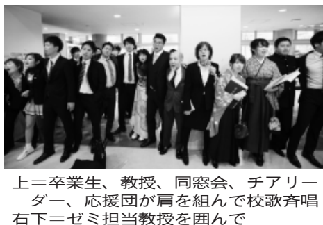
上=卒業生、教授、同窓会、チアリーダー、応援団が肩を組んで校歌斉唱 右下=ゼミ担当教授を囲んで