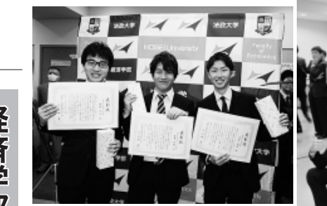
同窓会特別表彰の学生会代表3人